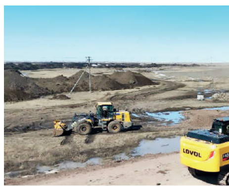
Аудан әкімдігінің мәліметінше, қала көшелерінен қыс бойы 180 мың текше метрден астам қар шығарылған.

Жаңа сайын қарғын судың зардабын жиі тартатын аймақта дүлей тасқынның алдын алу мақсатында бөлінген қаржыландыру да аз емес. Атап айтқанда, жарылыс жұмыстарына – 50 миллион теңге, жанар-жағармайға – 15 миллион, ал алдын алу шараларына 187 миллион теңге бөлінді. Бұл қаражатқа каналдар тазартылып, қорғаныс бөгендері нығайтылып, сонымен қатар жаналары салынған. Ауданда барлығы 22 су өткізу нысаны орнатылып, 39 мың қап пен 10 мың тоннадан астам инертті материал дайындалған. Бұдан бөлек, 31 жана мотопомпа сатып